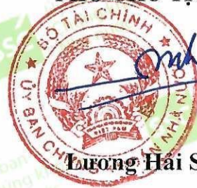
Lương Hải Sinh